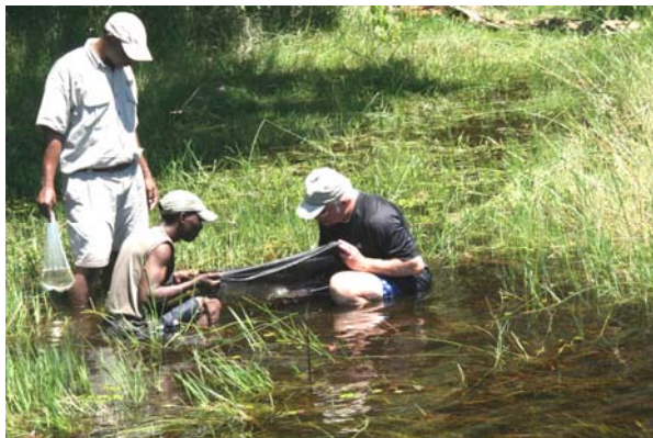
Auf Fischfang in Namibia