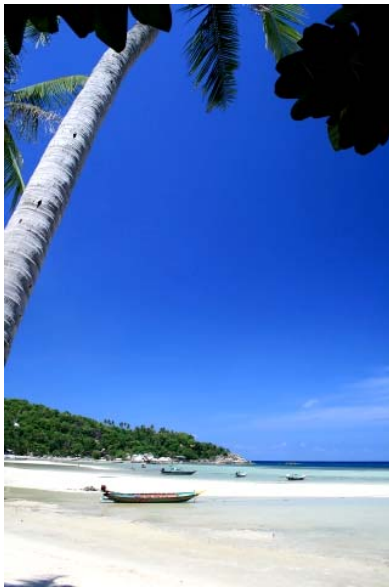
Strand auf Koh Tao