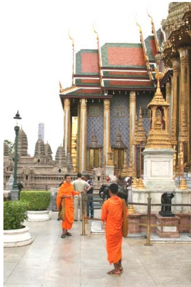
Mönche vor dem Großen Palast, Bangkok