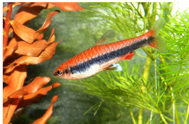
Nannostomus beckfordi „red“; Foto: H.-J. Ende

Die Gattung Nannostomus umfasst heute 18 Arten, darunter so farbenprächtige Fische wie N. mortenthaleri oder N. trifasciatus . Warum hat sich aber speziell N. beckfordi so in der Aquaristik durchgesetzt und ist auch zu meinem Favoriten geworden? Das beginnt schon mit den im Vergleich zu den anderen Arten relativ einfachen Haltungs- und Zuchtbedingungen. Das oben erwähnte riesige Verbreitungsgebiet bedingt, dass sich der Längsbandziersammler an unterschiedliche Wasserbedingungen anpassen musste und tatsächlich ist N. beckfordi die einzige Art der Gattung, die problemlos in mittelhartem Wasser zur Fortpflanzung zu bringen ist. Inzwischen gilt das allerdings mit gewissen Einschränkungen auch für aquaristisch „alte“ Arten wie N. eques und N. marginatus , die