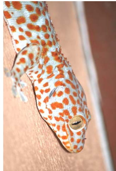
Token (Gekko gecko)